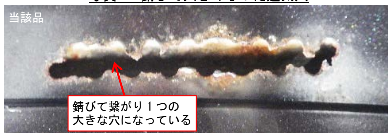
写真1. 錆びて大きくなった通気穴

当該品を分解して調べたところ、庫内壁面の裏に設置された熱風循環用の遠心ファンは激しく錆びており（写真2）、庫内に生じた黒い粉は遠心ファンが動作する際に崩れた錆が庫内に送り込まれたものと考えられました。